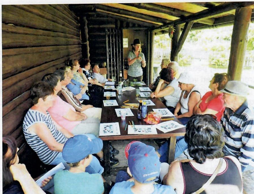
Obrázok 4 Seniori lúštia Lesnú abecedu, rok 2019