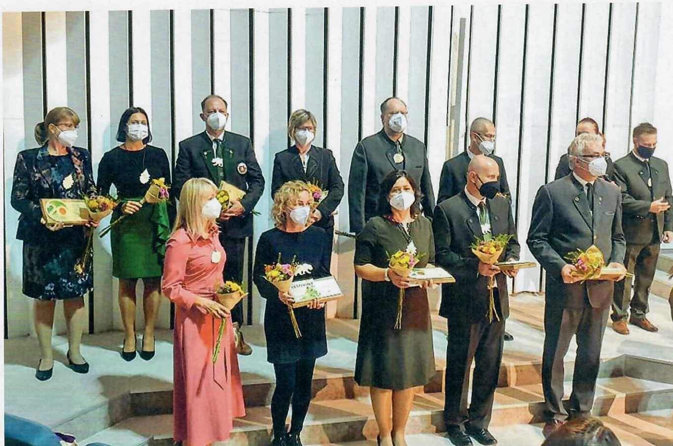
Ocenení lesní pedagogovia a lesnícke inštitúcie