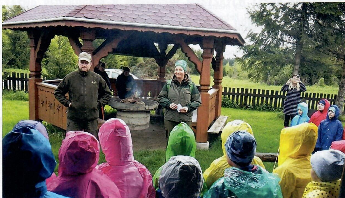
Obrázok 2 Deti z materskej školy prišli v roku 2019 do lesa aj v daždivom počasí