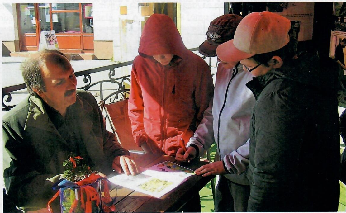
Obrázok 1 Lesník zo spoločnosti počas Lesníckych dní v Kežmarku, rok 2012

Celoslovenskou aktivitou, na ktorej sa už od roku 2012 spoločnosť Lesy mesta Spišská Belá, s. r. o., spolupodieľa, sú Lesnícke dni v Kežmarku (obrázok 1). Cieľom podujatia je pozitívne prezentovať lesníctvo verejnosti.