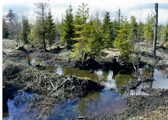
Lokalita pri štátnej ceste, z ktorej boli bobrie hrádzy odstránené.

Špeciálnu starostlivosť venujeme jedli bielej. Jedľa je v našich lesoch pevnou súčasťou dlhodobej stratégie, zameranej na premenu súčasných lesov na zmiešané porasty. Investujeme do ochrany sadeníc, pričom ako najúčinnější metóda sa nám osvedčila výsadba sadeníc do vybudovaných oplôtkov (za posledných 5 rokov sme ich spravili 20 kilometrov a len v roku 2022 7,5 kilometra).