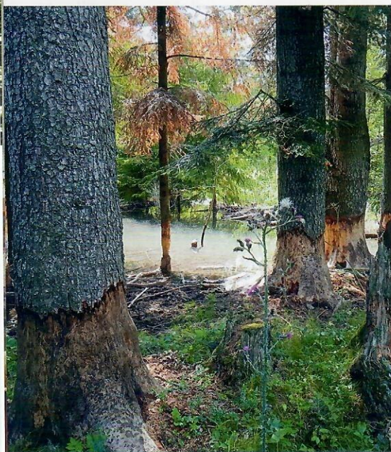
Bobrami ohryzené jedle.