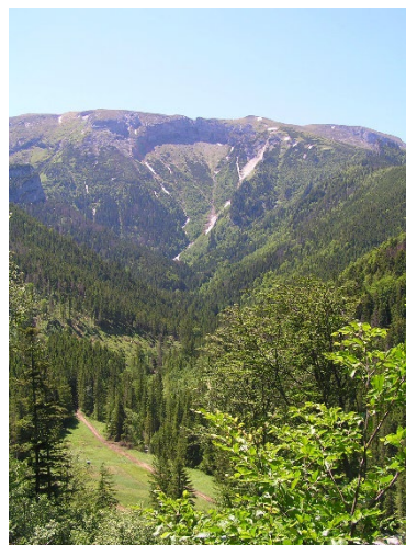
Tokáreň (vľavo) a Košiare (vpravo), zdroj: archív Lesy mesta Spišská Belá (2022)