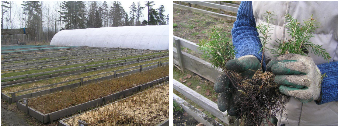
Foto: Lesná škôlka Šarpanec, zdroj: archív Lesy mesta Spišská Belá, 2021

ako 10 780 ha. Vybudovalo a rekonštruovalo sa 21 km lesných ciest a 6 km odvodňovacích kanálov, viac ako 19 km oplôtkov proti zveri.