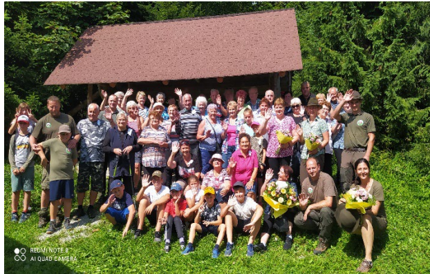
Kôň pri práci v lese (vľavo), Seniori v mestských lesoch (vpravo)