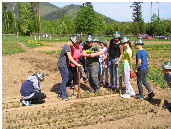
Deti pri zalesňovaní a v lesnej škôlke Flak, zdroj: archív Lesov mesta Spišská Belá (2020)